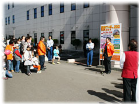
今年で8回を数える「防災ワンデー」

また、アトラクションとして、わかかさ保育園幼年消防クラブの「わかかさ太鼓」・釧路風の子保育園幼年消防クラブの「風の子ソーラン」・日赤さかえ保育園幼年消防クラブの「新・よさこいソーラン」をはじめ、市民防災センターの各種体験、ちびっこ放水体験、小型はしご車の試乗、NHKキャラクター「どーもくん・たーちゃん」との記念写真撮影会など、さまざまなイベント体験を行い防災行動力について学んでいただきました。