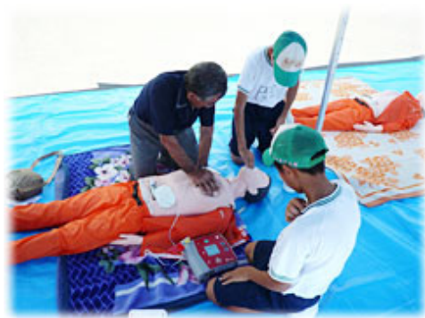
新和中学校生徒がAED取扱いを指導

指導にあたった生徒は、「初めは緊張したけど、前日に十分練習したので自信が付きました。将来は消防士になりたいと思っているので、この経験を活かし頑張ります。」と話してくれました。