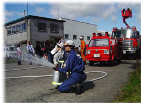
ちびっこ放水体験

このほかに、「防災ラーメン」と称した屋台のラーメン（300食）の販売や住宅用火災警報器・非常持出品の展示、非常食の試食、子供たちには無料で風船を配布するなど、「防災ワンデー2010」が多くの市民の参加により成功裡に所期の目的を達成することができ、防災ワンデーをひとつの契機として、更なる防火・防災の意識を高めるとも