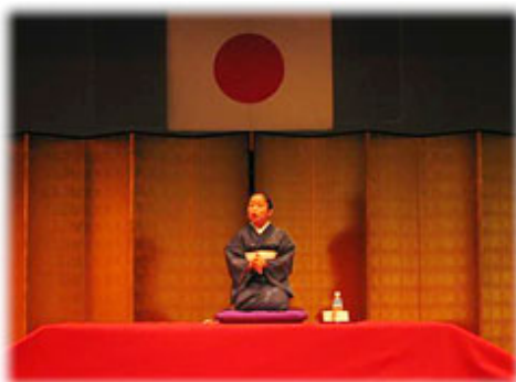
阪神淡路大震災を題材にした防災落語