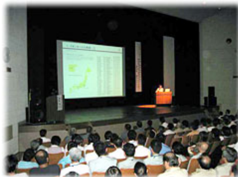
婦人防火クラブによる活動発表

本事業を通じて、防災に関する意識の向上と、住警器の設置を促すための印刷物やパンフレットを配布したため、事業終了後に住警器に関する問い合わせや共同購入の申し込み等があるなど、大きな反響がありました。