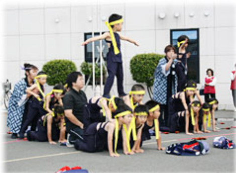
釧路風の子保育園幼年消防クラブの「風の子ソーラン」