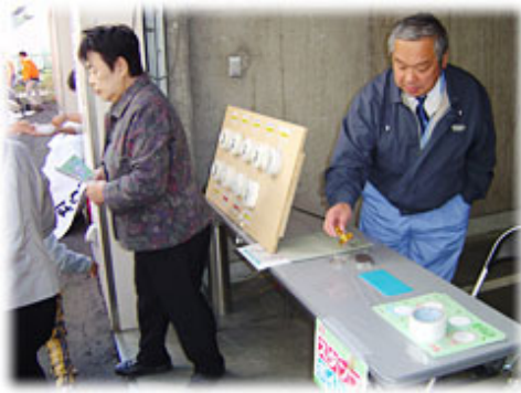
住宅用火災警報器展示コーナー