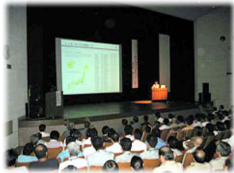
婦人防火クラブによる活動発表

本事業を通じて、防災に関する意識の向上と、住警器の設置を促すための印刷物やパンフレットを配布したため、事業終了後に住警器に関する問い合わせや共同購入の申し込み等があるなど、大きな反響がありました。