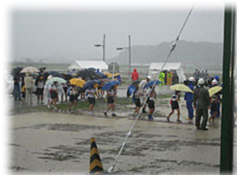
避難誘導訓練(小学生)