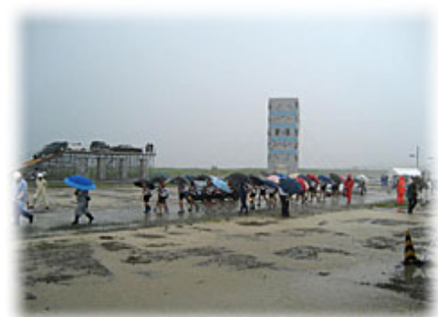
避難誘導訓練(小学生)