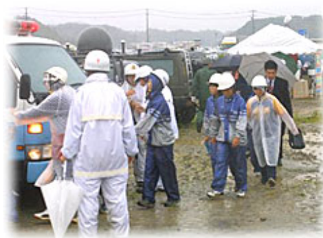
避難誘導訓練(中学生)