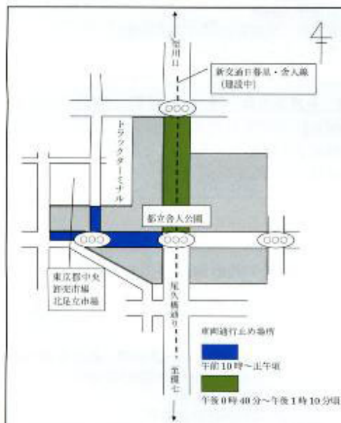
都立舎人公園会場