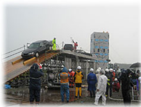
高架道路車両多重衝突訓練