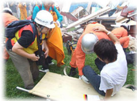
■ 足立区合同防災訓練パンフ