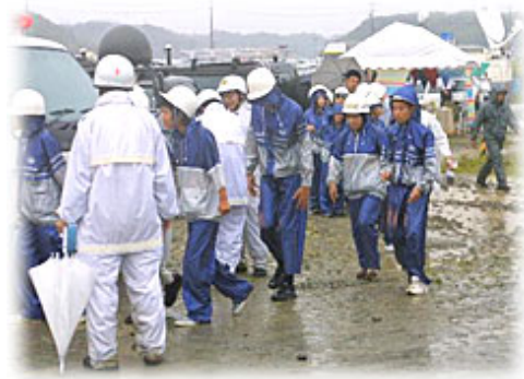
避難誘導訓練(中学生)