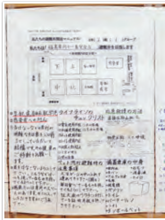
避難所マニュアル成果品

避難所に指定されている当該中学校。災害時に共助の担い手として支援できるよう、避難所開設訓練等を実施するとともに、避難所開設マニュアルを作成しました。