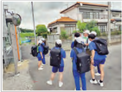
地域の方とまち歩き

生徒同士が協力して意見を出し合いながらまち歩きを行い、マップを作成したことで、自助力、共助力の強化が図られました。