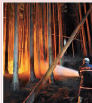
安渡地区を防御する大槌町消防団第二分団員