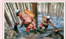
樹木内部へ消火する東京消防庁隊員