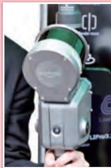
空間を画像化できるハンディスキャナー