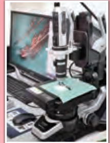
火災原因調査のためのデジタル顕微鏡