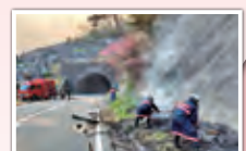
唐楸で消火中の大槌町消防団第二分団員