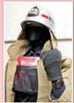
熱中症発症リスク判定スマートウォッチ（左手）と冷却ベスト