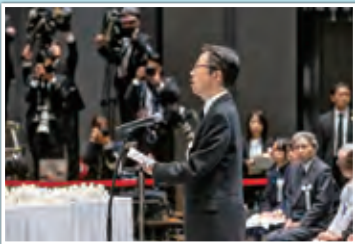
木村敬熊本県知事による式辞