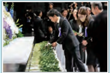
参列者による献花