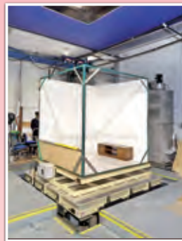
地震動を再現できる振動実験棟