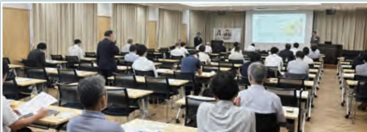
地方公共団体職員、消防職員ほかが参加して、4名の講師による講演が行われました。