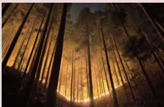
大槌町吉里吉里地区の延焼状況