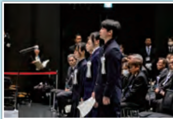
高校生4名による「誓いのことば」