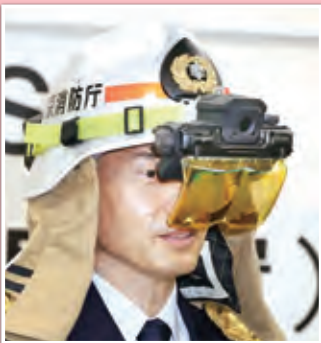
濃煙中視覚支援装置