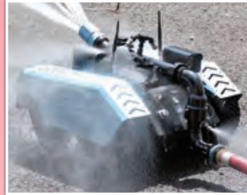
リモコン式無人放水車