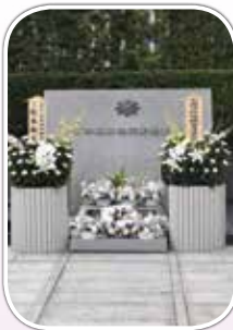
日本消防会館屋上の慰霊碑