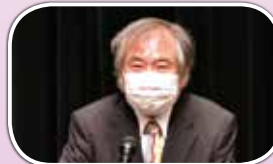
新たな発展への期待を述べる室崎益輝兵庫県立大学教授