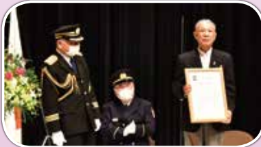
笹川陽平日本財団会長に特別感謝が渡された