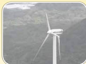
鹿児島県薩摩川内市