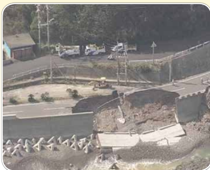
鹿児島県南さつま市