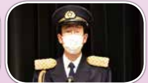
新たな発展への決議を述べる三輪和夫日本消防協会理事長