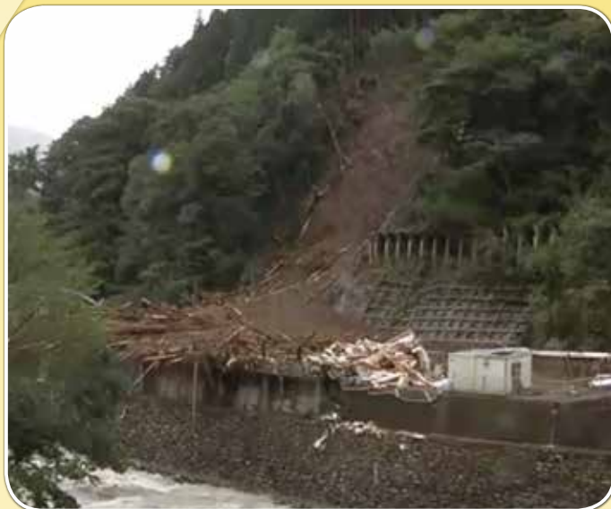
宮崎県椎葉村の土砂崩れ (手前は球磨川)