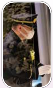
総務大臣代理横田真二消防庁長官