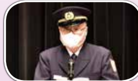
挨拶する総務大臣代理横田真二消防庁長官