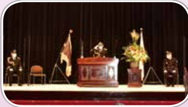
秋本敏文日本消防協会会長の主催者挨拶