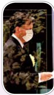
内閣総理大臣代理大沢博内閣官房内閣審議官