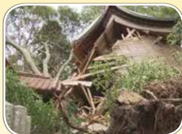
福岡県糸島市の雉琴神社