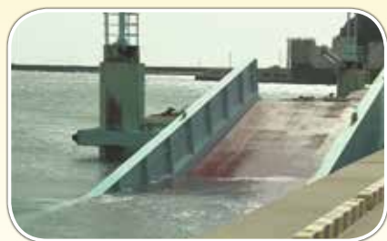
長崎県対馬市の厳原港