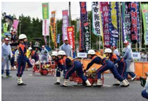
第23回全国女性消防操法大会(秋田県秋田市で開催)