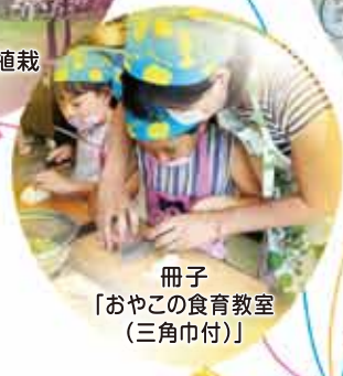
冊子 「おやこの食育教室 (三角巾付)」