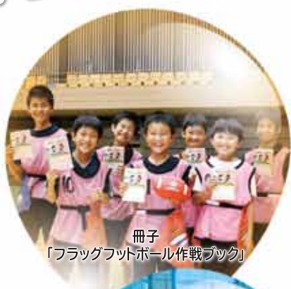
冊子 「フラッグフットボール作戦ブック」