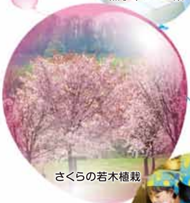
さくらの若木植栽