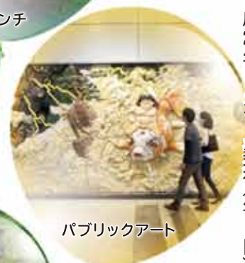
パブリックアート