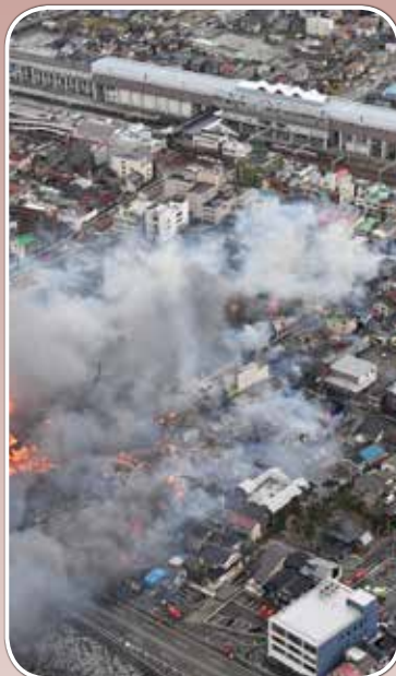
上側は J R 糸魚川駅舎