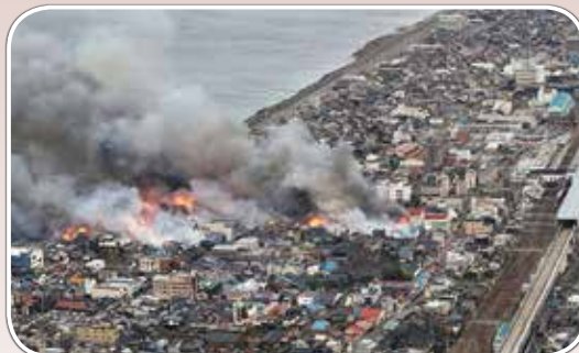
左側は日本海、右側が J R 糸魚川駅