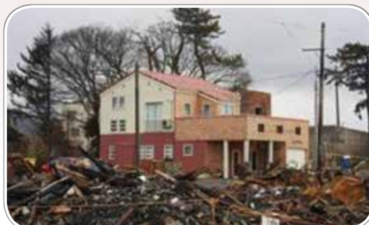
奇跡に残った建物