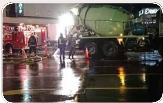
水利の確保のため地元建設業者の コンクリートミキサー車36台も活用された