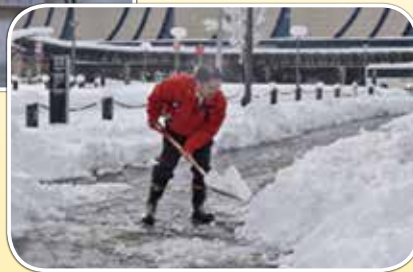
京都府JR福知山駅前（1月24日）