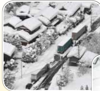
鳥取県智頭町で車が立ち往生、自衛隊も出動（1月23日～24日）