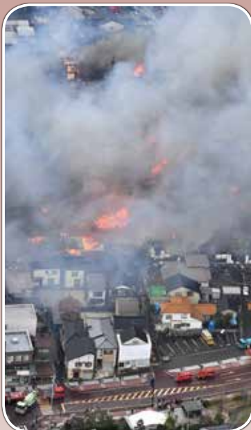
車両126台、消防職・団員1,005名が 出動した