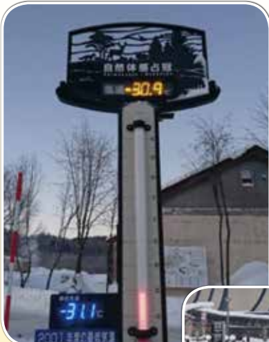
北海道占冠村で-30.9℃を記録（1月23日）