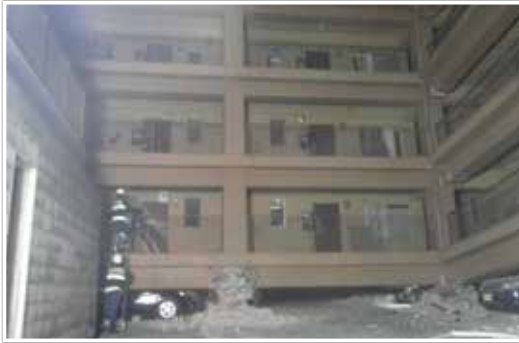
座屈マンションへの進入

強い余震が継続していることから、倒壊する前に直ちに各住戸を検索し、逃げ遅れ者の救助活動にかかりました。