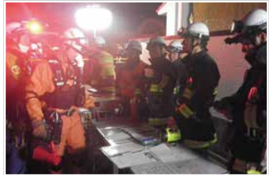
福岡県隊との合同指揮の様子

屋上部分を確認すると、らくだの背中のように大きく波打ち、東側に進むにつれ下方へ傾斜しており、建物のダメージが強いことがわかりました。屋上から7階の要救助者へ向け呼びかけると反応があり、4名とも負傷がないことが確認できたため、隊員2名の増援及び単梯子の屋上への搬送を